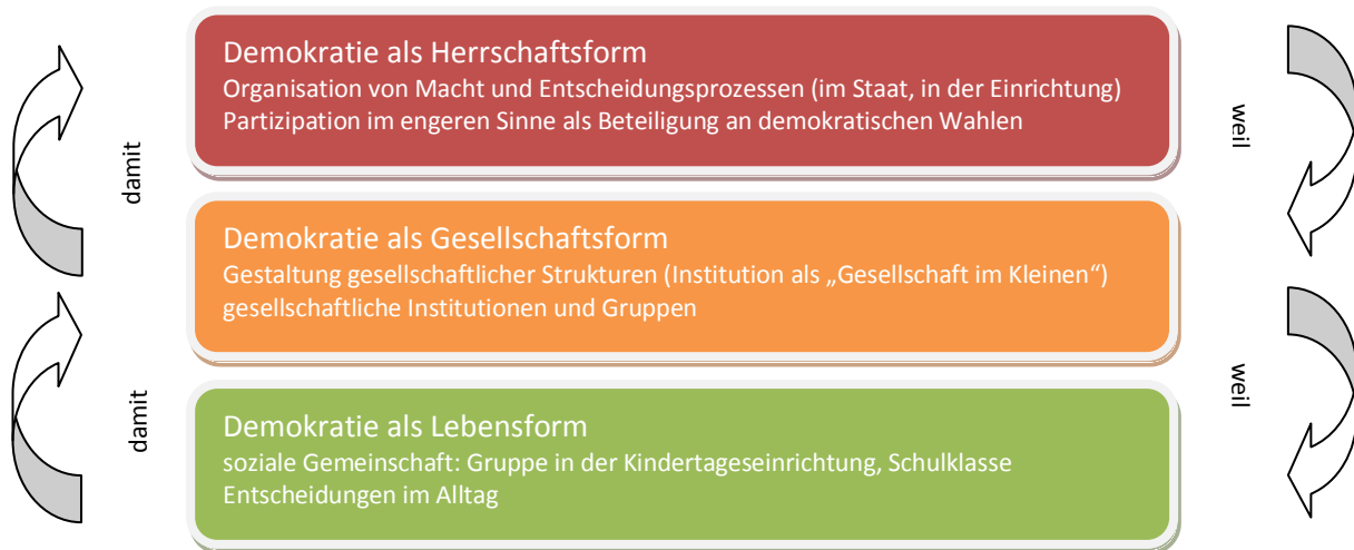
Abbildung 2: Die Institution in einer Demokratie und Demokratie in Institutionen

In Bezug auf die Schule bezeichnen Soziologen die Funktion dieser öffentlichen Institutionen, die durch die Vermittlung gesellschaftlicher (demokratischer) Normen und Werte auf die Rechtfertigung der politischen und gesellschaftlichen Ordnung abzielt, als Legitimationsfunktion bzw. Integrationsfunktion (vgl. Herzog 2009, S. 158).