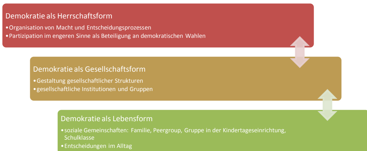
Abbildung 1: Demokratie als Herrschafts-, Gesellschafts- und Lebensform